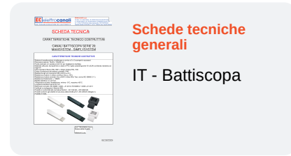
Schede tecniche generali IT - Battiscopa