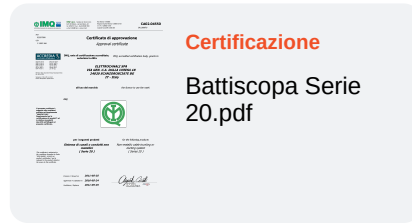
Certificazione Battiscopa Serie 20.pdf