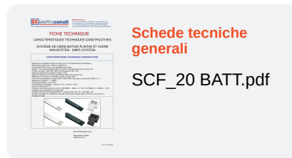
Schede tecniche generali SCF_20 BATT.pdf